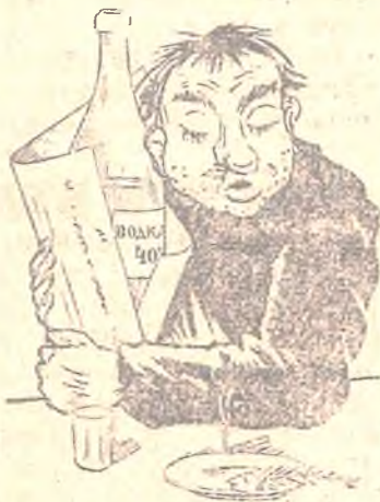
Полюбил я ее, полюбил го ячо!...